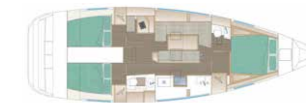
VERSION 214 - OPTION