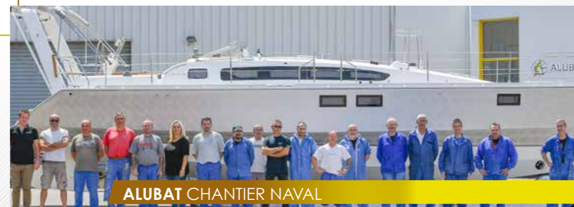
ALUBAT CHANTIER NAVAL

42, avenue Louis Bréguet / Z.I Les Plesses 85180 LE CHATEAU D'OLONNE - FRANCE 0033 (0)2 51 21 08 02 info@alubat.com www.alubat.com