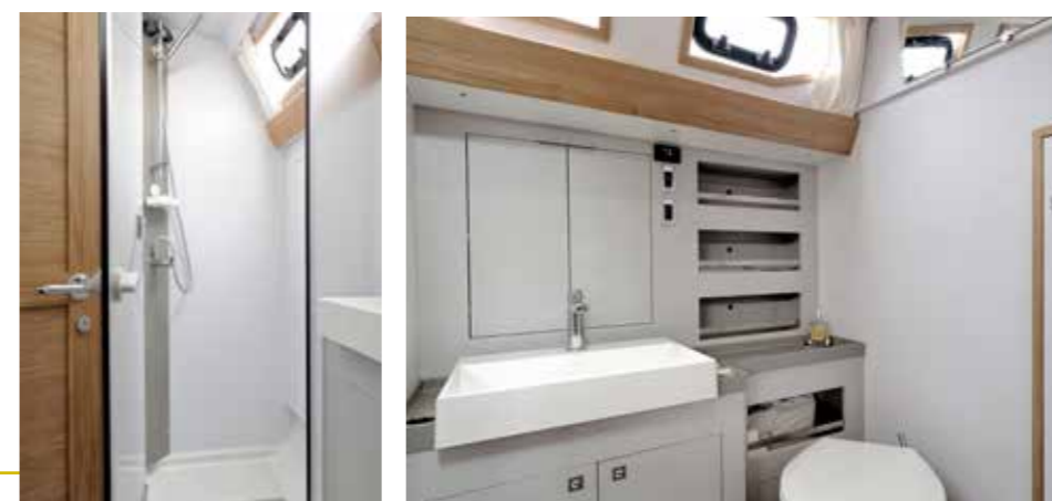
GRANDE SALLE D'EAU ARRIÈRE AVEC DOUCHE SÉPARÉE Large aft head compartment with separate shower