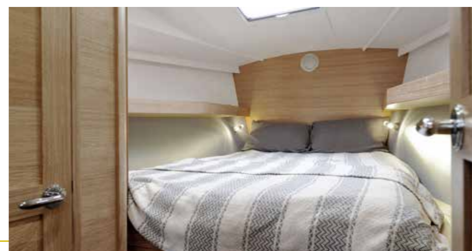
CABINE AVANT PROPRIÉTAIRE Owner fore cabin