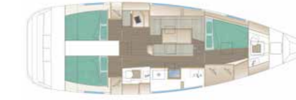
VERSION 212 - OPTION