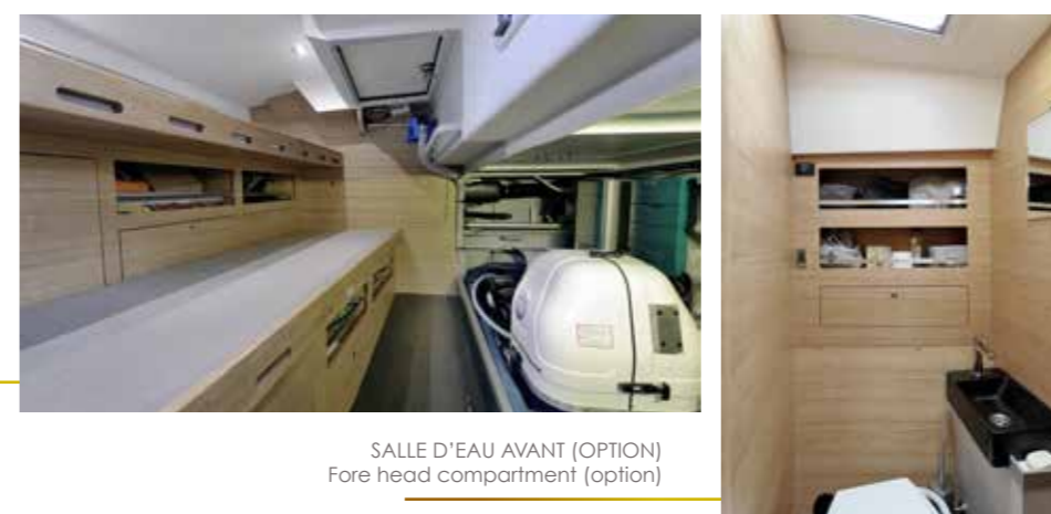
SALLE D'EAU AVANT (OPTION) Fore head compartment (option)