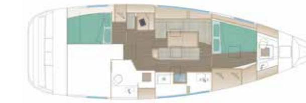
VERSION 112 - OPTION