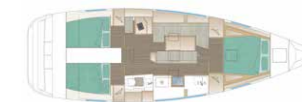
VERSION 211 - OPTION