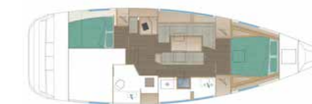
VERSION 111 - STANDARD