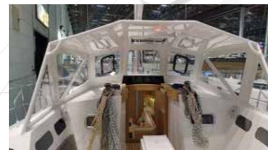
Capote rigide aluminium / Dog House (OPTION)

Following the success and great performances of the OVNI 445 designed by Marc Lombard we decided it was time for an evolution of our 45 feet.