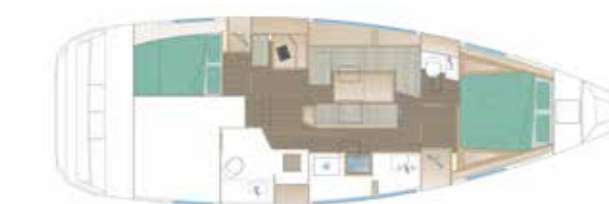
VERSION 114 - OPTION